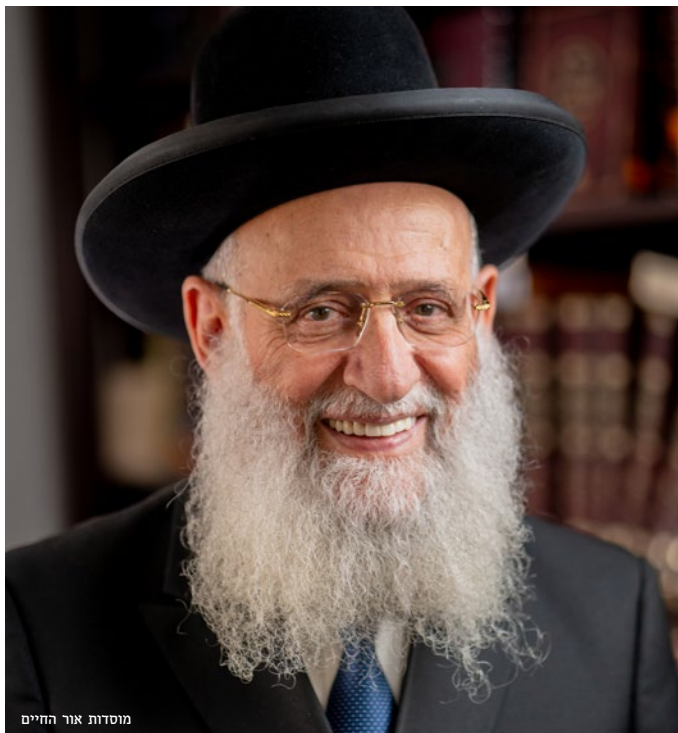
מוטות אור החיים

להם מזון ושתייה. הצמא התחיל להציק להם יותר ויותר. לעת ערב החליט אחד הבחורים ללכת לנוח זמן קצר, כדי שיוכל לקום בכוחות מחודשים. שני הבחורים האחרים התייאשו מלצפות, עזבו את היער והלכו לקנות אוכל ושתייה. אמרו השניים זה לזה: "מסכן, הוא נשאר שם, בטוח שה' ישלח לו. האם נשאיר אותו בלי אוכל?" שבו אל היער והביאו איתם כל טוב, והבחור לא ידע בלכתם ובשובם.