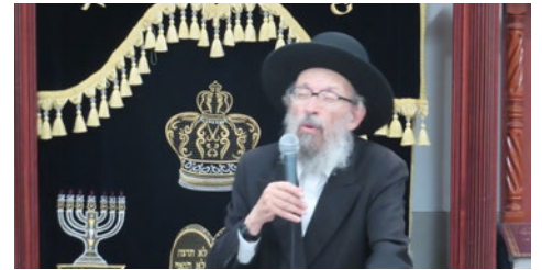
והשינה ידו ומצא פרי נאִלְתוֹ (כה)

הגה"צ רבי יצחק קולדצקי שליט"א: ישנו ספר נפלא בשם 'מעלות המידות' שכתב החכם הקדמון רבי יחיאל הרופא זצ"ל, הוא מייחד פרק בספר למעלת הזריזות. וכך הוא כותב: "דעו בני, כי מעלת הזריזות היא מידה חשובה, לפי שמתחילת ברייתו של אדם לא נברא אלא להיות זריז במעשיו ודרכיו. כענין שנאמר 'ויהי האדם לנפש חיה' - מאי חיה זריזתא". המקור שלו מן הסתם הוא תרגום יונתן בן עוזיאל על הנאמר במילדות העבריות "כי חיות הגה" - זריזות. המיוחד באדם הוא הזריזות שלו. זו ה'נפש חיה' שבו. ואשר על כן, את הזריזות חובה לנצל למצוות.